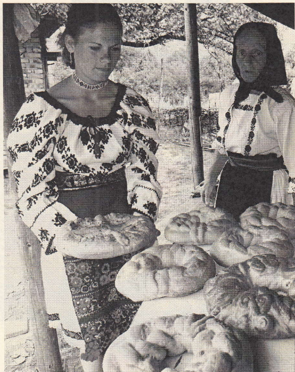
Bucate tradiționale de Paști